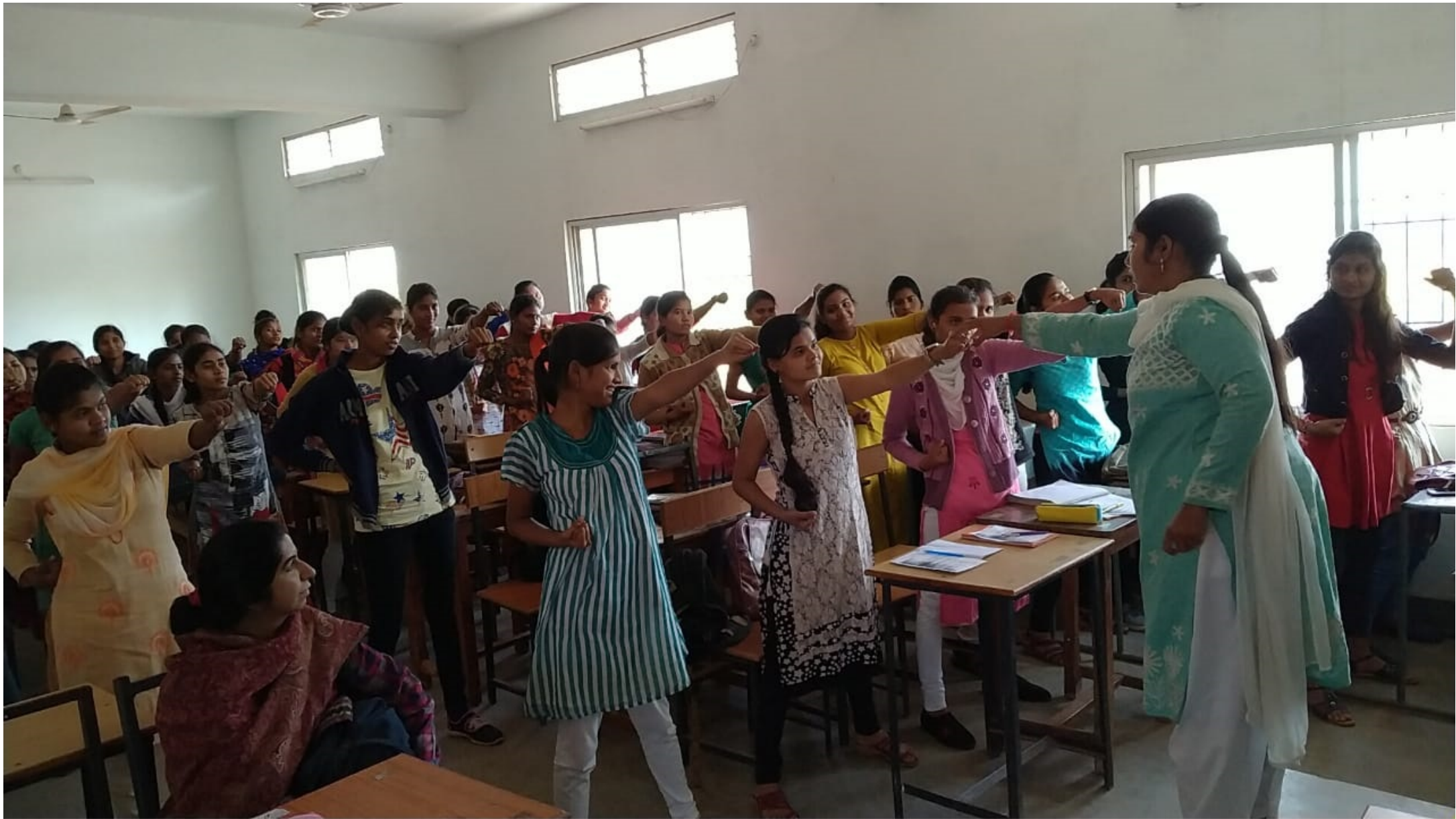
Self Defence Techniques Demonstration