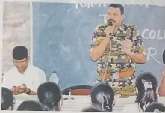
छात्र-छात्राओं को अपराधों के प्रति किया गया जागरूक।