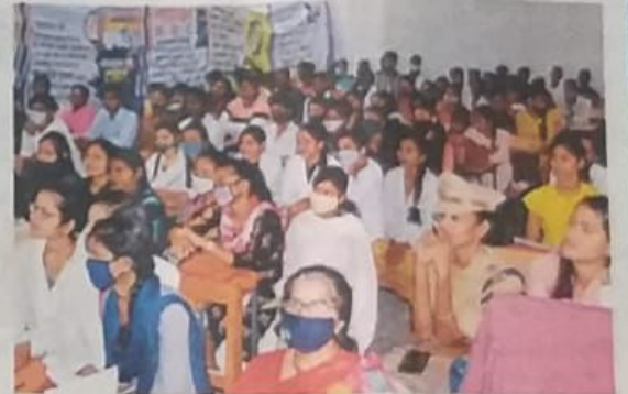
शिविर में शामिल छात्राओं ने विभिन्न कानून की जानकारी ली।