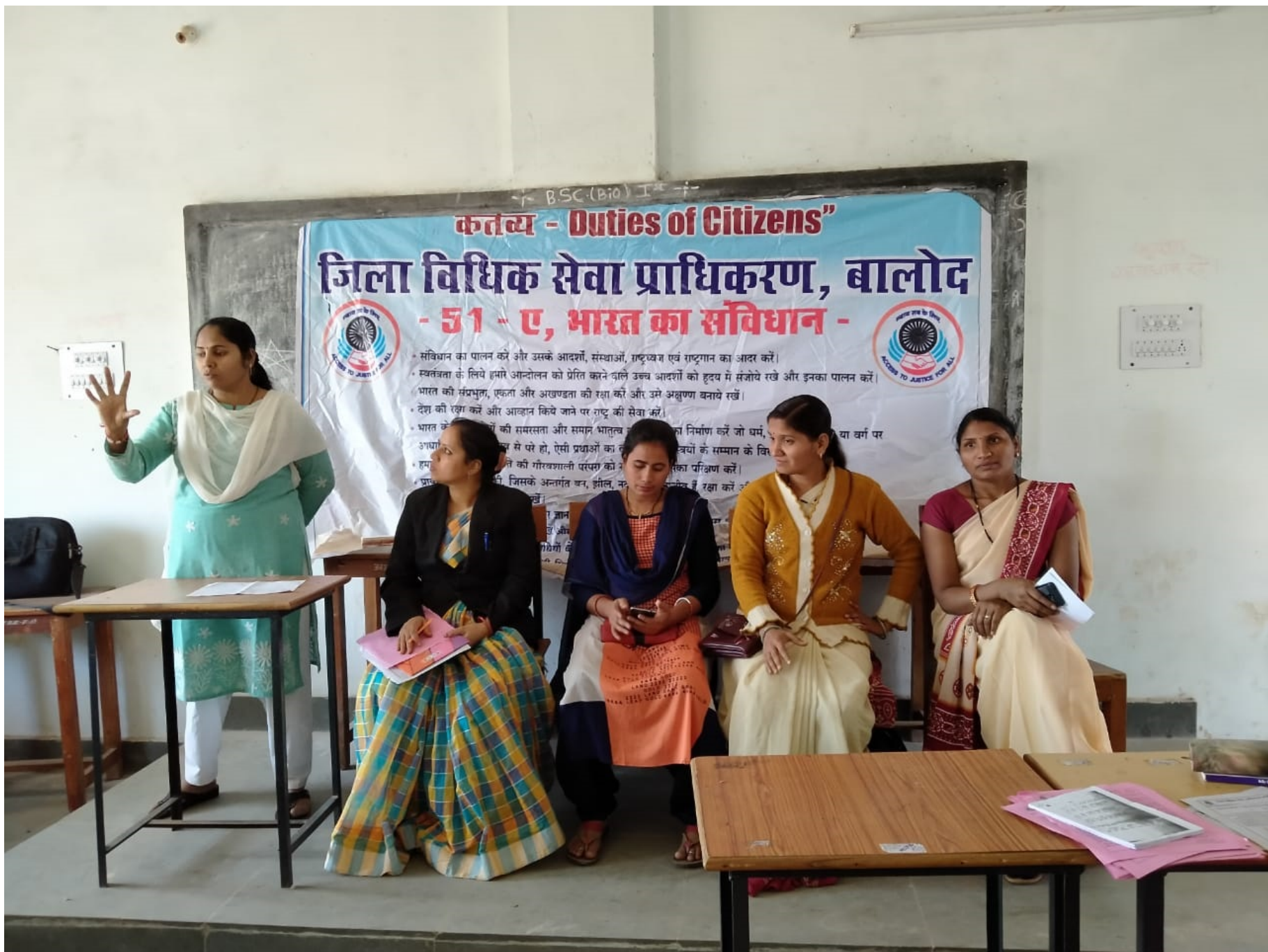
Self Defence Awareness and Techniques