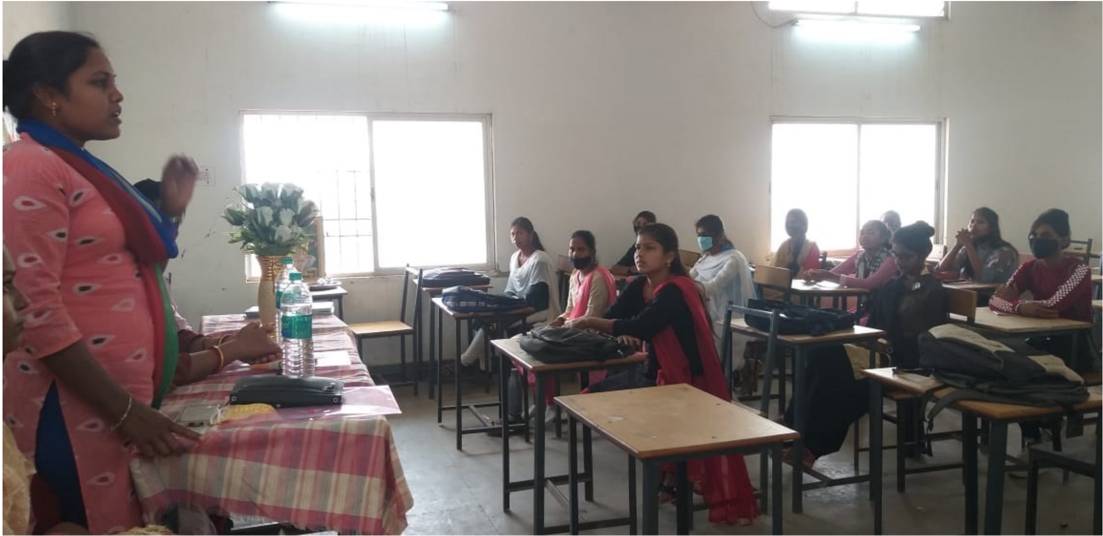
Awariness Programme on Gender Equality